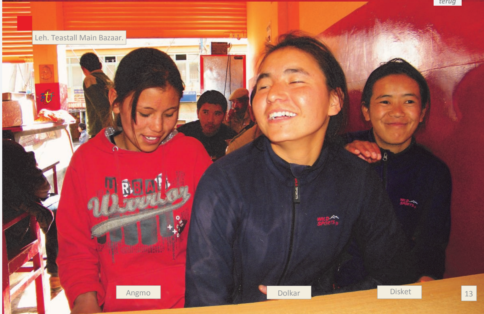
Leh. Teastall Main Bazaar.