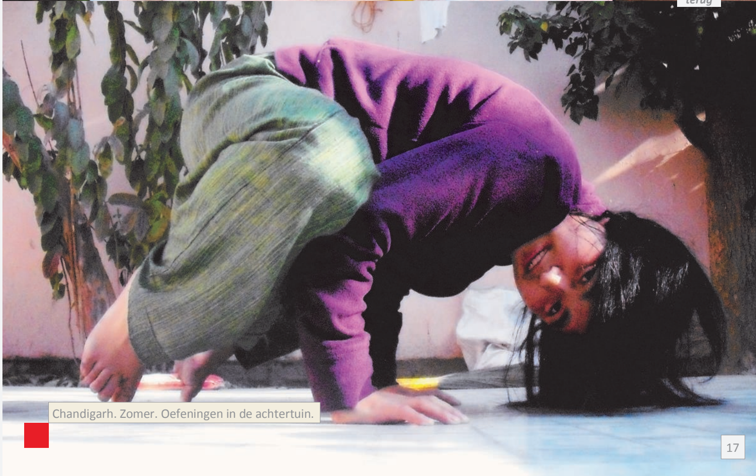
Chandigarh. Zomer. Oefeningen in de achtertuin.