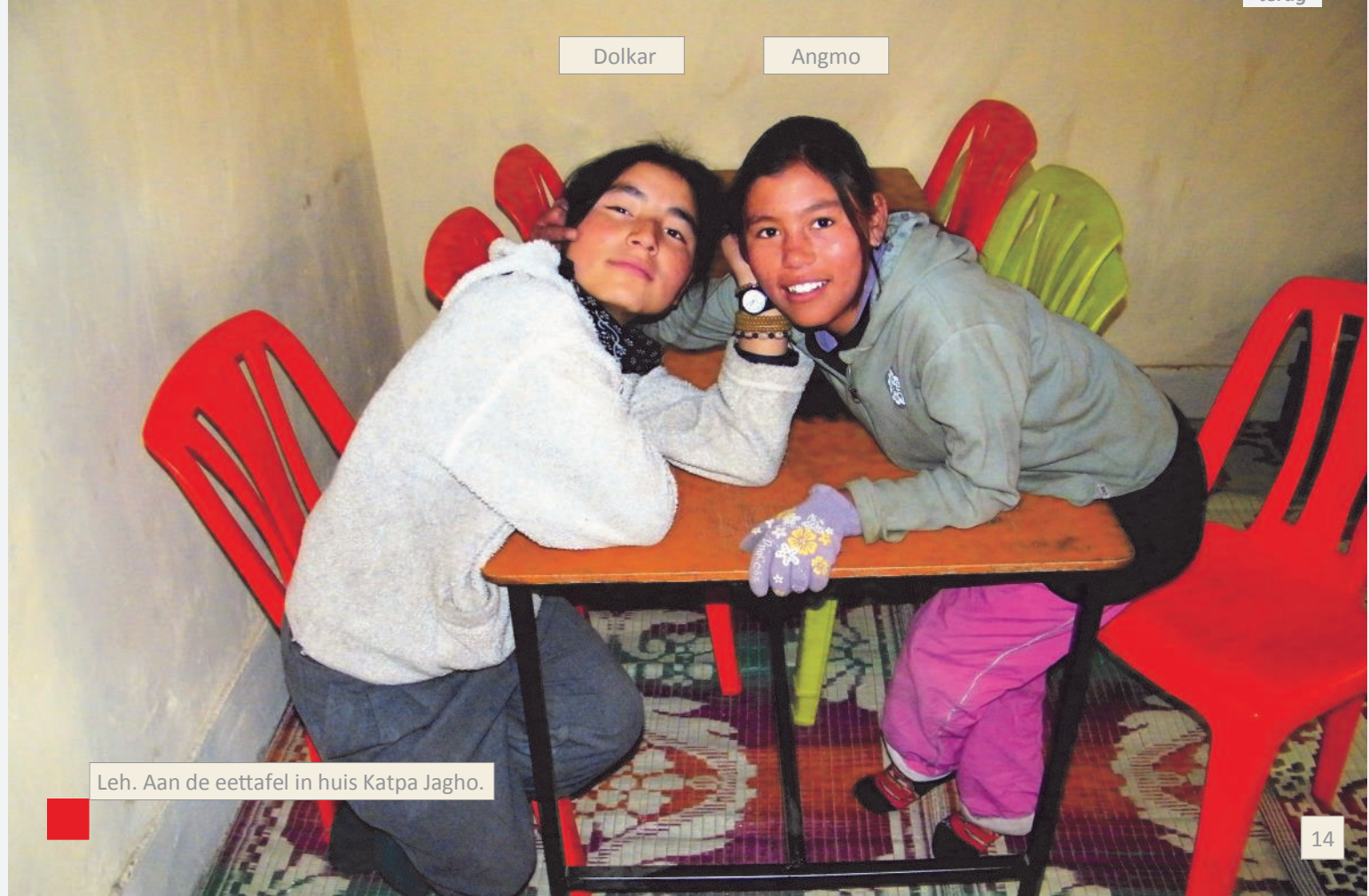
Leh. Aan de eettafel in huis Katpa Jagho.