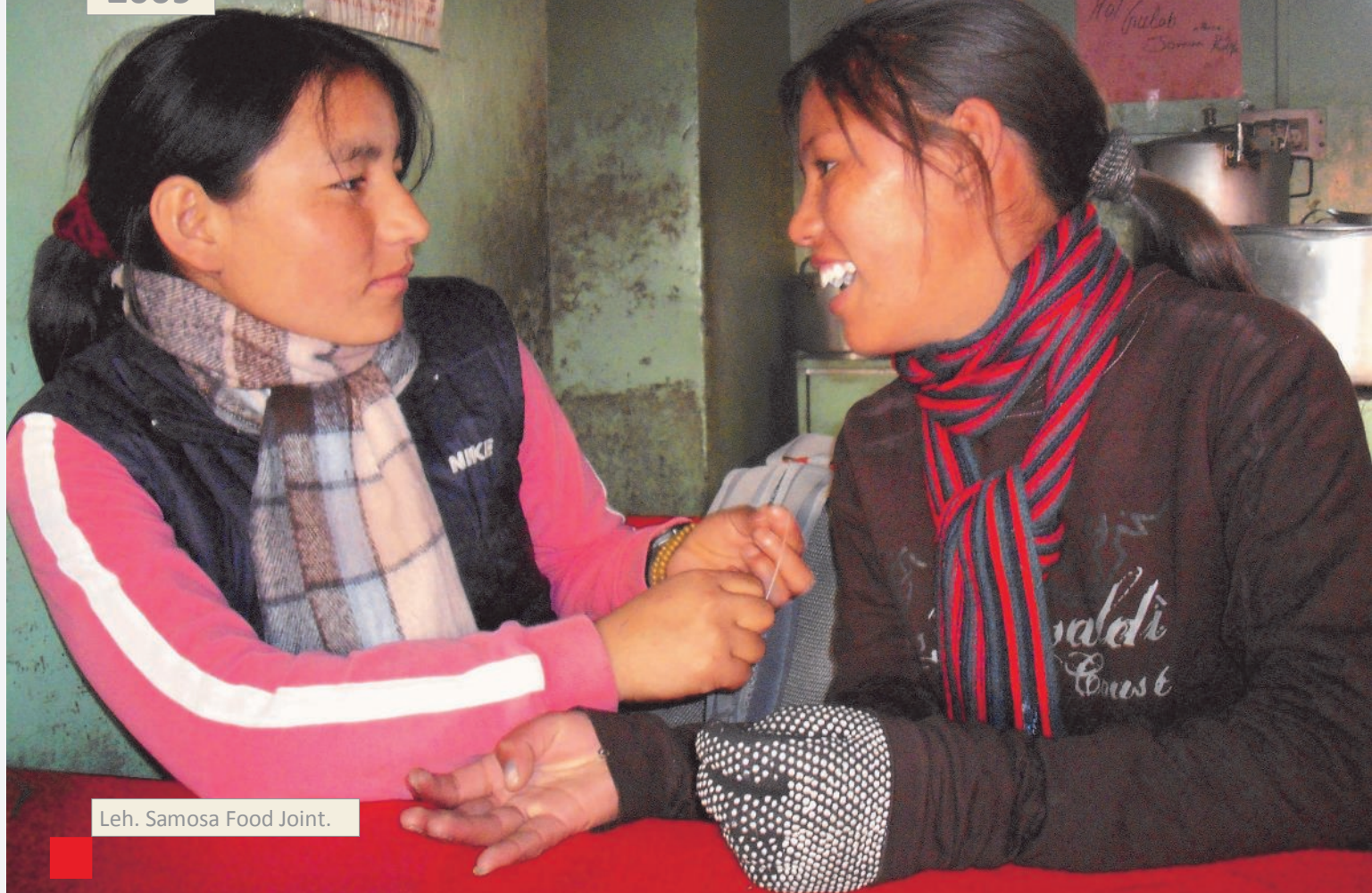
Leh. Samosa Food Joint.