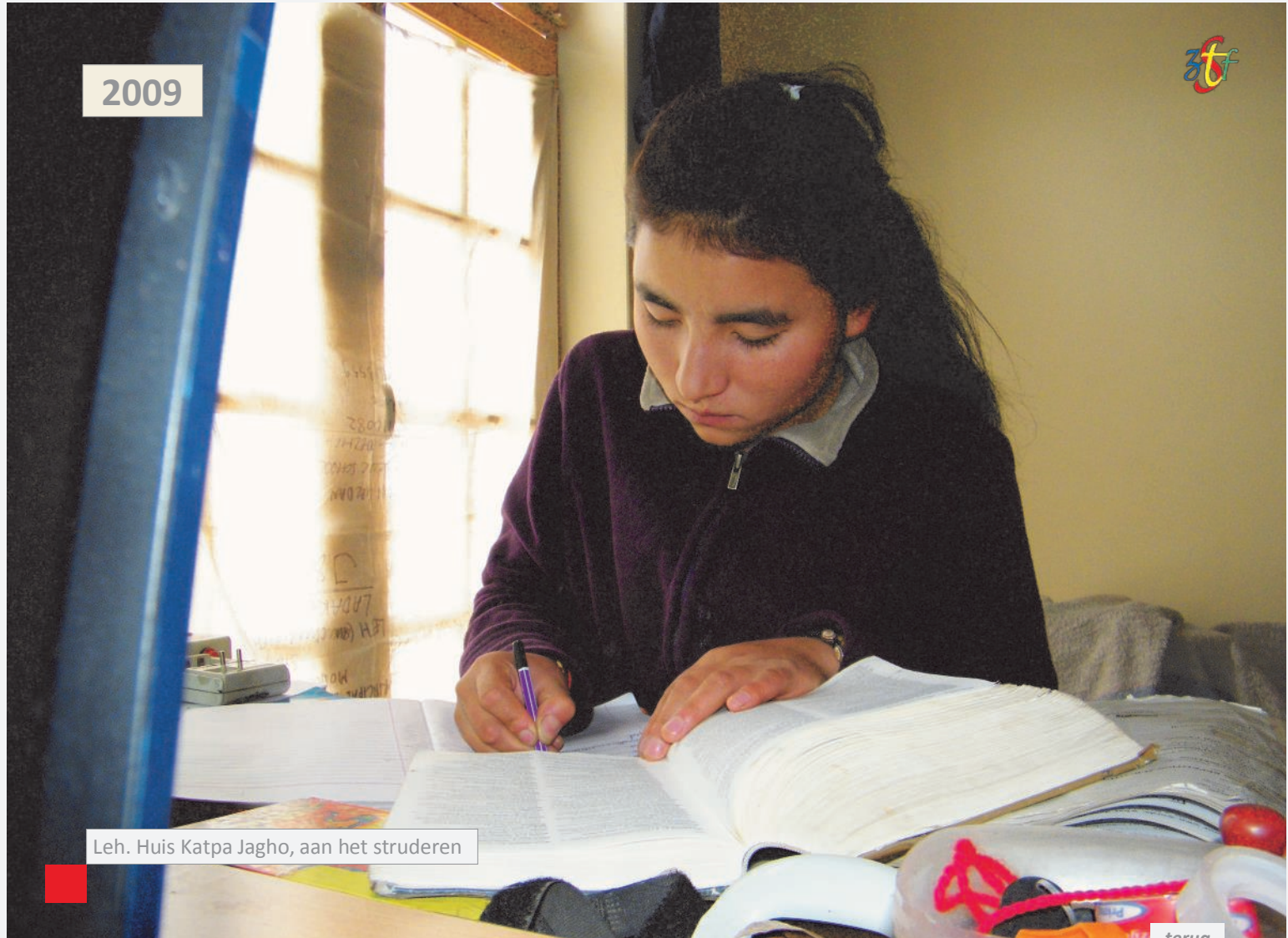
Leh. Huis Katpa Jagho, aan het struderen