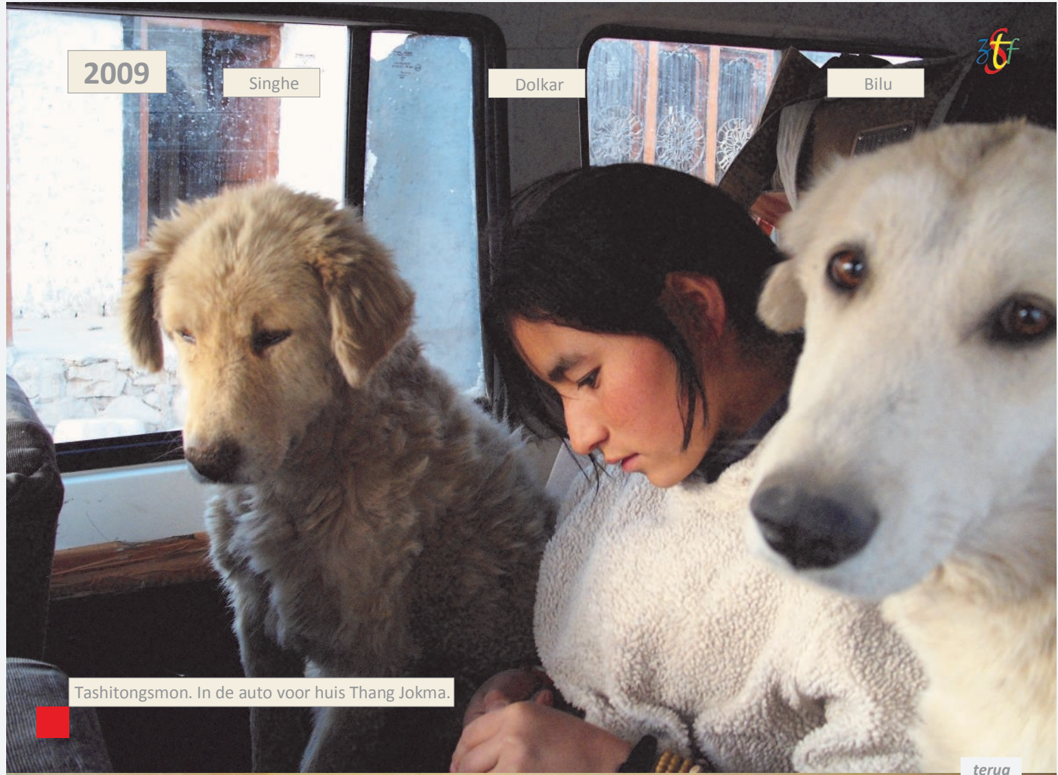
Tashitongsmon. In de auto voor huis Thang Jokma.