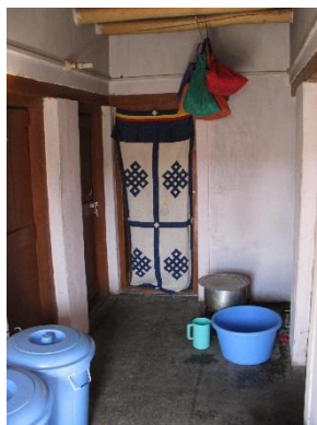
De gang met de watervoorraad in de blauwe vaten